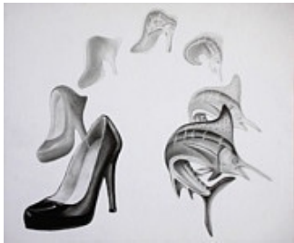
Obra de arte terminada

4. Una vez que tengas un plan para tu transformación, comienza tu obra de arte final. Dibuja un total de 5 o 6 objetos llevando el registro del proceso de transformación en una hoja de papel nueva.