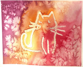
Obra de arte terminada