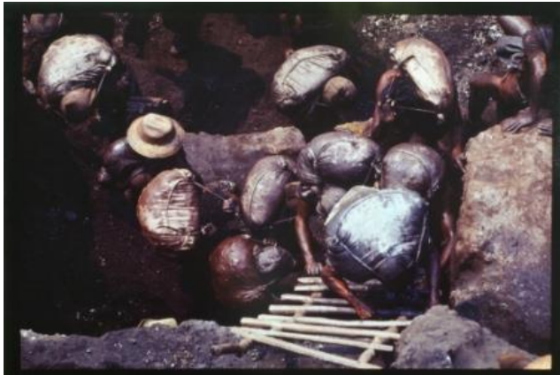
Miguel Rio Branco, brasileño, n. 1946 Serra Pelada , 1985 Impresión Cibachrome 26 1/8 x 38 1/2 in 66.4 x 97.8 cm 2008.4.3 Obsequio del artista Colección del Museo de Arte Haggerty, Universidad Marquette