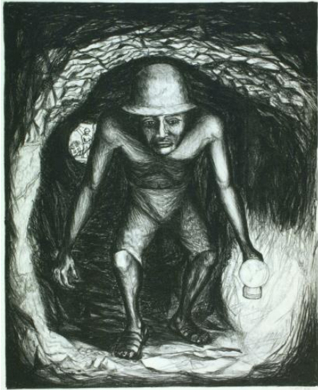
Francisco Mora, mexicano, 1922 – 2002 Trabajador de Mina de Plata, 1946 Litografía 17 1/2 x 15 1/4 in 44.5 x 38.7 cm 2008.11.6 Obsequio de un donador anónimo Colección del Museo de Arte Haggerty, Universidad Marquette